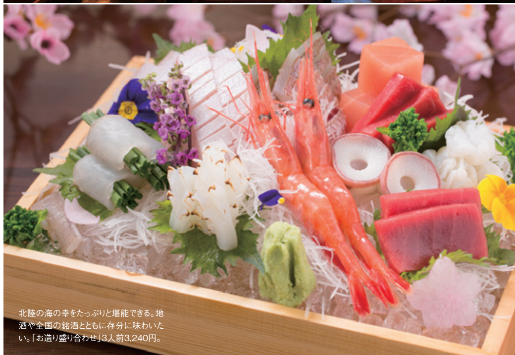
北陸の海の幸をたっぷり堪能できる。地酒や全国の銘酒とともに存分に味わいたい。「お造り盛り合わせ」3人前3,240円。