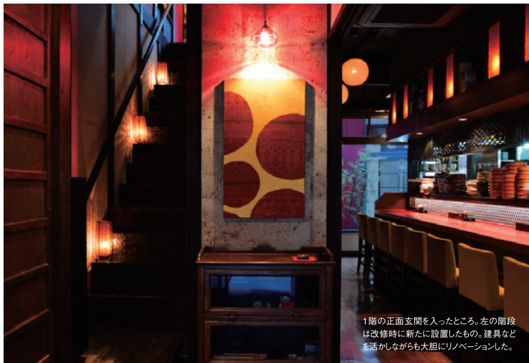
1階の正面玄関を入ったところ。左の階段は改修時に新たに設置したものを。建具などを活かしながらも大胆にリノベーションした。

金沢市本町2-2-1 ☎(076)223-7680 営/18:00~23:30 休/日曜(月曜が祝日の場合、営業) 席/51席 ※喫煙可 P/なし ■主なメニュー 飲み放題120分付きコース5,000円 ~ (要予約) 刺身900円~、のどぐろ塩焼き1,980円、加賀蓮根天ぷら750円、串焼き各種1本150円他。