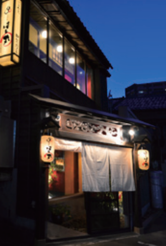
勝手口側にも店内への出入口を配置。門構えには欄間を取り入れた。

新 幹線開業後、変化の激しい金沢駅界隈だが、本町周辺には古い町家が点在してどこかホッとする趣がある。居酒屋の『はち丸』もそのうちの一つ。大正期の建築と伝わる町家を改修した空間は、2年前に再び改修を重ねて和モダンな雰囲気にはブラッシュアップ。座敷席の壁は朱色や鶯色に塗装され、茶屋風の雰囲気醸し出した印象となった。そんな艶やかな空間の中で味わえるのは、地魚や加賀野菜を活かした金沢らしい一皿。地元客はもちろん、遠来客も喜ぶ品揃えと採算度外視という手頃な価格が魅力だ。昨年にはほど近い場所に別館も誕生。こちらは古い民家を大胆に改築し、レンガ造りの外観に。趣向を凝らしたレトロ調の佇まいが個性的だ。